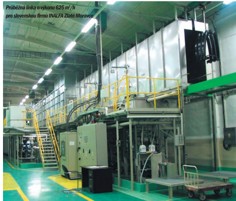
Průběžná linka o výkonu 625 m 2 /h pro slovenskou firmu INALFA Zlaté Moravce

Kataforetické lakování je vysoce hospodárný a ekologický způsob lakování patřící mezi nejmodernější technologie povrchových úprav kovových výrobků. Používá se pro ochranu především ocelových, dále i pozinkovaných a hliníkových součástí, a to buď k základování nebo k tzv. jednovrstvému lakování jako finální povrchové úpravě. U řady výrobků lze dosáhnout podstatného zvýšení užitných vlastností a životnosti a tím i konkurenceschopnosti a prodejnosti, v řadě aplikací navíc kataforeza díky vlastnostem procesu i povlaku nemá v současné době srovnatelnou konkurenci.