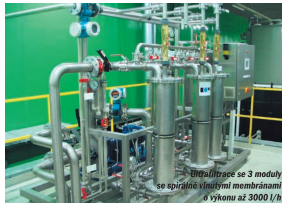
Ultrafiltrace se 3 moduly se spirálně vinutými membránami o výkonu až 3000 l/h

ba kapek či „závoju“; možnost vrchního lakování různými laky; bezpečnost - nejsou nutná opatření proti požáru či výbuchu či zvláštní opatření pro bezpečnost práce; nízké zatížení pracovního prostředí.