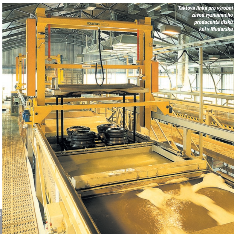
Taktová linka pro výrobu závod významného producenta disků kol v Maďarsku

Mezi hlavními přednostmi lze uvést: minimální zatížení životního prostředí díky nízkému obsahu rozpouštědel (okolo 2 %), minimálnímu množství emisí, pevných odpadů a odpadních vod; vysoká korozní odolnost povlaku (i přes 1000 hod v solné mlze; rovnoměrná tloušťka povlaku na celém povrchu včetně těžko přístupných míst, hran a rohů, možnost řízení tloušťky; vysoká přilnavost a mechanická odolnost povlaku; vysoká hospodárnost – minimální ztráty barvy díky prakticky materiálově uzavřenému okruhu barvy; snadná automatizace a kontrola procesu, nízká pracovní a nízké nároky na obslužný personál; žádná tvor-